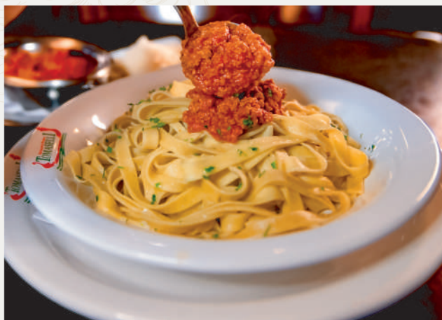
Fettuccine ao molho Ragu di Carne

Pão bola italiano recheado com camarões dourados envolvidos em creme de Catupiry® acompanhado de fettuccine caseiro ao molho de manteiga fresca.