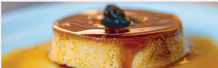
Pudim de Leite

Bolo de sorvete polvilhado com chocolate em pó no sabor menta. (Consultar sabores)